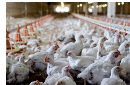
Die überwiegende Mehrheit der Hühner in der Schweiz wird in Hallen mit mehreren Tausend Tieren gehalten.

getötet werden. Bei Beständen von mehreren Tausend Hühnern ist es allerdings kaum vorstellbar, dass die Halter diesen Pflichten tatsächlich genügend nachkommen, weshalb von einer sehr hohen Zahl von Tierschutzverstössen auszugehen ist.