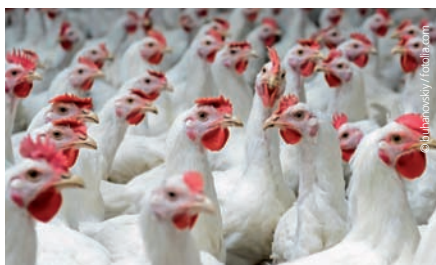
An Hühnern begangene Tierschutzdelikte werden von den Behörden nur in den seltensten Fällen verfolgt.

Verantwortung und Text: Stiftung für das Tier im Recht Grafik: popjes.ch