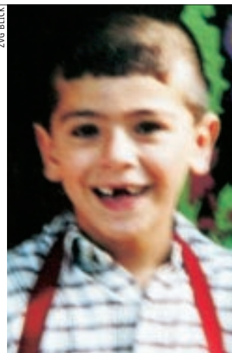
SULEYMAN La mort du bambin d'Oberglatt (ZH) et l'émotion qui a suivi sont à l'origine des débats actuels sur les chiens de combat.

«En muselant tous les chiens dans les parcs, le Conseil d'Etat a fait sienne la position du lobby des molosses qui, précisément, contestait toute possibilité de différencier entre plusieurs races.»