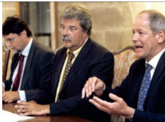
GENÈVE EN FOLIE Conférence de presse surréaliste le 21 août dernier, avec trois membres du gouvernement pour parler des chiens.