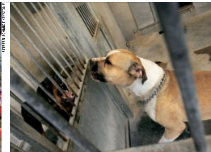
AMERICAN STAFFORDSHIRE Ce chien a tué une fillette de 17 mois à Gennevilliers cet été, entraînant les mesures draconiennes dites Sarkozy.

née autour des fermes, en principe en liberté et donc en contact avec des promeneurs. Leur potentiel de nuisance est logiquement incomparable à celui d'un pitbull qu'aucun propriétaire raisonnable ne laisserait vagabonder. En résumé: il faudrait idéalement une statistique du nombre de morsures, hiérarchisées selon leur gravité et commises dans l'espace public en fonction de la durée que les chiens de différentes races passent à l'extérieur.