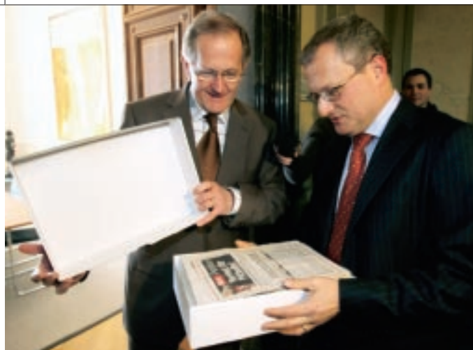
PÉTITION Werner De Schepper, rédacteur en chef du Blick , remettant les 175 000 signatures anti-molosses à Joseph Deiss en décembre 2005.