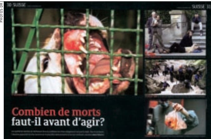
LA QUESTION Le 15 décembre 2005, L'Hebdo s'interrogeait sur l'immobilisme des autorités suisses.

Le débat s'est même répercuté jusqu'au sommet de l'Etat: au soir de la démission de Joseph Deiss, le 27 avril, certains de ses proches citaient la manière humiliante dont le Conseil fédéral avait refusé son projet d'interdire les races dangereuses comme une des raisons qui avaient justifié sa décision de retrait... Il doit savourer sa revanche aujourd'hui, puisque le feu vert de la commission du Conseil des Etats, lundi 28 août, va permettre au Par-