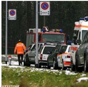
Rettungskräfte in Oberglatt.