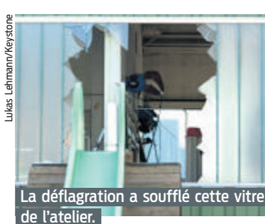
La déflagration a soufflé cette vitre de l'atelier.

Le quinquagénaire a été retrouvé dix-huit minutes après l'alarme. Les tentatives de réanimation n'ont pas permis de le