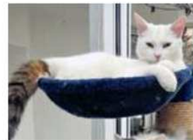
Kater Spike wurde überfahren.

timann. Hier droht gar eine Gefängnisstrafe von bis zu drei Jahren. ANN