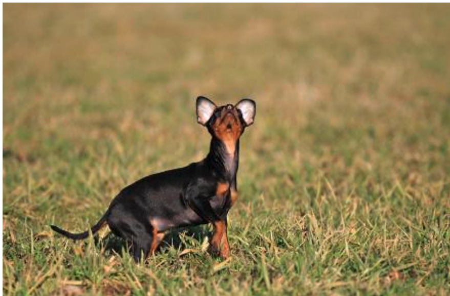
Ein Zwergpinscher-Welpen wurde Opfer der Misshandlungen.

Man hätte gerne gewusst, was den vom Sozialamt lebenden Mann zu diesem Verhalten trieb. Doch vor Gericht lässt er die Übersetzerin sagen: «Herr Richter, ich habe nichts gemacht. Machen Sie, was Sie wollen. Der Hund ist mein kleiner Schatz.» Das einzige Zugeständnis, das er vorübergehend machte, war der Hinweis, dass ihm der Rucksack möglicherweise und versehentlich einmal auf den Boden gefallen sei. Aber