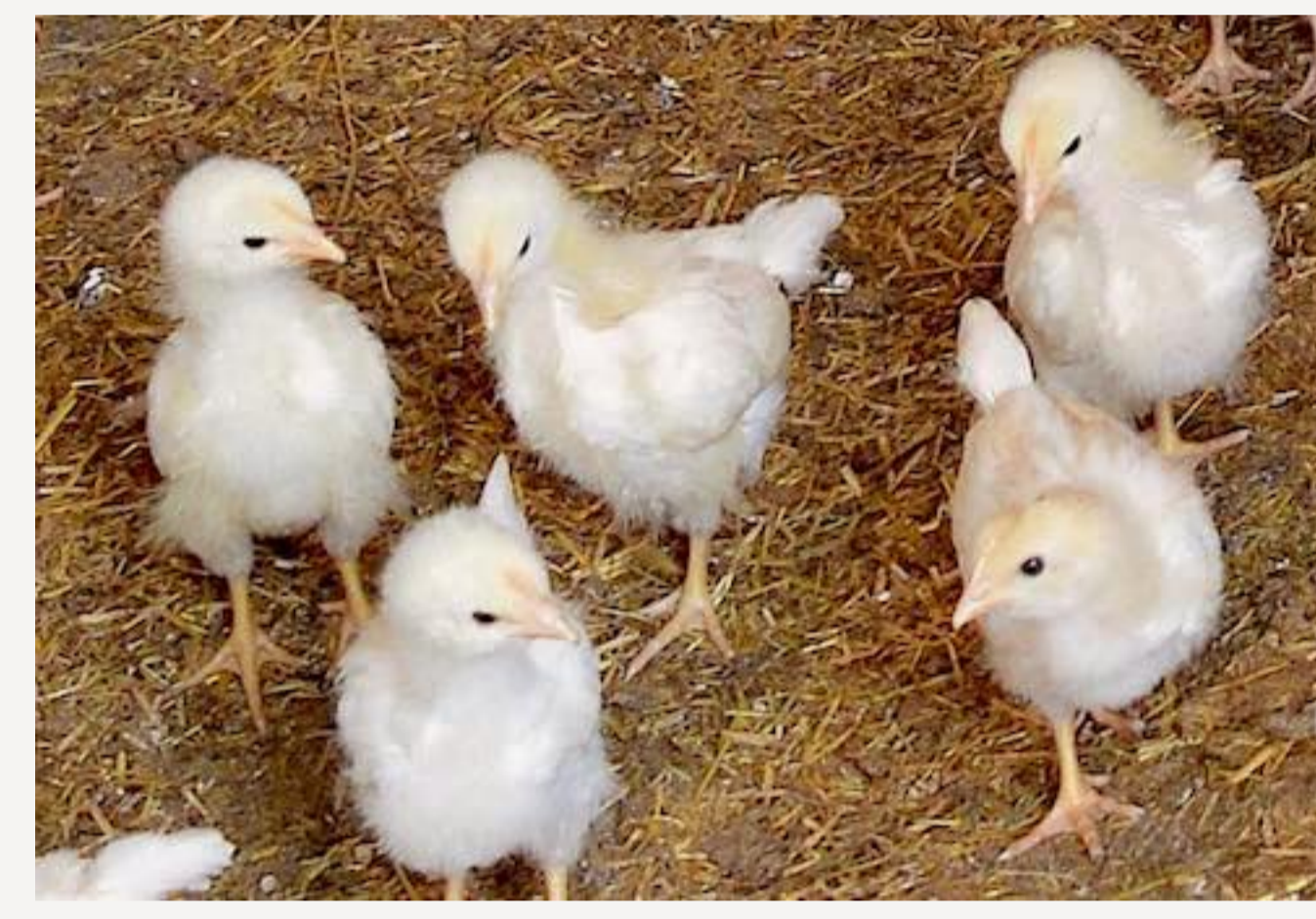
Die wenige Tage alten Küken im Aufzuchtstall

„Die Hähnchen werden in einem separaten Aufzuchtstall eingestallt, denn sie benötigen viel Wärme und Schutz. Wenn sie ein genügend dichtes Federkleid haben, werden sie im Alter von drei bis vier Wochen in den Mobilstall umgestallt. Sichtlich vergnügt und zufrieden (eben glücklich!) sonnen sich die Federbäuschchen in den geöffneten Luken in der Morgensonne und picken im Auslauf vom taufrischen Gras. Im Stall herrscht ein angenehmes Klima. Mit Dachluken lassen sich Wärme und Luftzufuhr manuell regulieren. Vier Futterautomaten und die Tränke in der Mitte sorgen fürs leibliche Wohl.