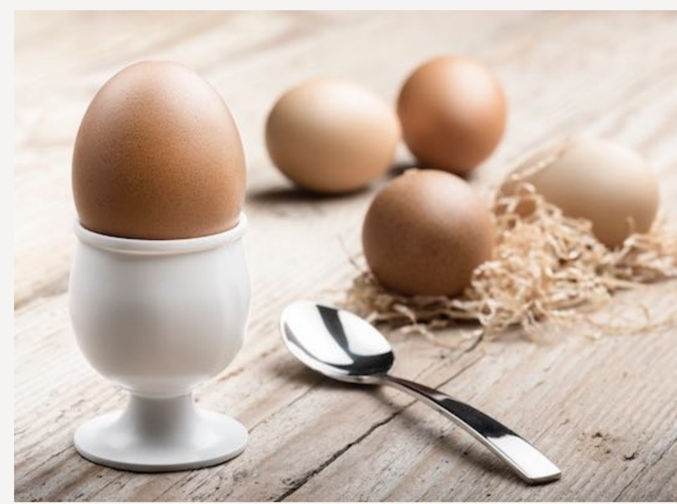
Eier gehören mit zu den meistgekauften Demeter-Produkten.

Eier gehören mit zu den meistgekauften Demeter-Produkten. Wenn man davon ausgeht, dass eine Legehenne pro Jahr 250 Eier legt, dann sucht gleichzeitig ein „Hahn im Glück“-Junghahn jährlich einen Käufer. Kurz gesagt: Wer fünf Eier wöchentlich verpeist, schenkt einem Junghahn das Leben. Demeter-Eierkonsum bedeutet, dass man die Verantwortung dafür übernimmt, dass auch der Hahn, der ja keine Eier legen kann, als Lebensmittel für den Menschen dient.