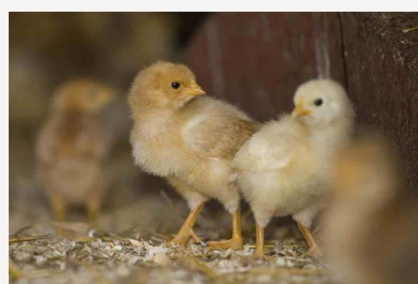
Hähnchen oder Hühnchen? Bei Demeter nicht eine Frage um Leben und Tod, denn beide wachsen auf.

Im Rahmen der Eierproduktion werden in der Schweiz jedes Jahr rund zwei Millionen männliche Küken von einseitigen Legehennenzuchtlinien an ihrem ersten Lebenstag als «industrieller Abfall» vergast oder geschreddert, da sie keine Eier legen und, im Gegensatz zu den für die Fleischproduktion gezüchteten Masthühnern, langsamer an Gewicht zulegen und somit für die Produzenten «wertlos» sind. Dieses höchst fragwürdige Vorgehen widerspricht klar dem in der Bundesverfassung wie auch im Tierschutzgesetz verankerten Prinzip des Schutzes der Tierwürde. Durch das Töten der Küken als unerwünschtes Nebenprodukt wird deren Eigenwert vollständig missachtet. Dennoch wird diese Praktik von der Tierschutzverordnung erlaubt. Um solchen lebensverachtenden Auswüchsen im Umgang mit Nutzhühnern entgegenzuwirken, braucht es politische Entscheidungsträger, Behörden und die Gesellschaft, die für die Anliegen der Tiere genügend sensibilisiert sind. Nur so kann dem Tierwürdekonzept tatsächlich zum Durchbruch verholfen werden.“